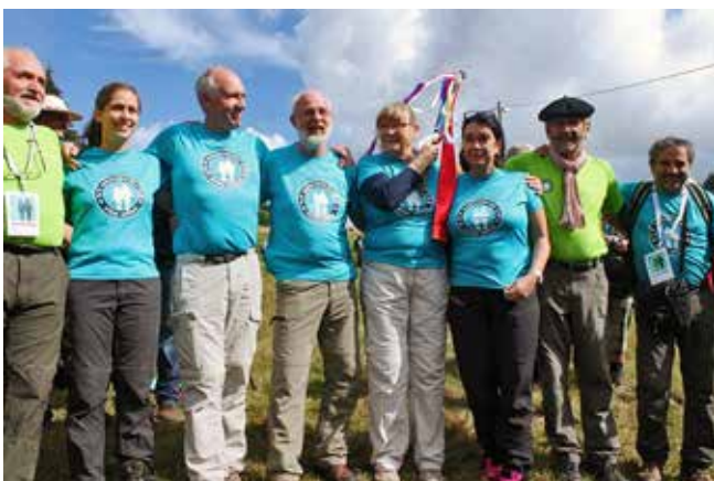
Des représentants de 5 pays arborant un tee-shirt ER 16

Randonnées Euroorando : le 27 septembre a été organisée la première « randonnée Euroorando » dans le coin des trois frontières entre Pologne, Slovaquie et République Tchèque. Ce fut un moment très festif en présence de 600 randonneurs et de représentants de 13 pays. Un coup d'envoi très réussi !