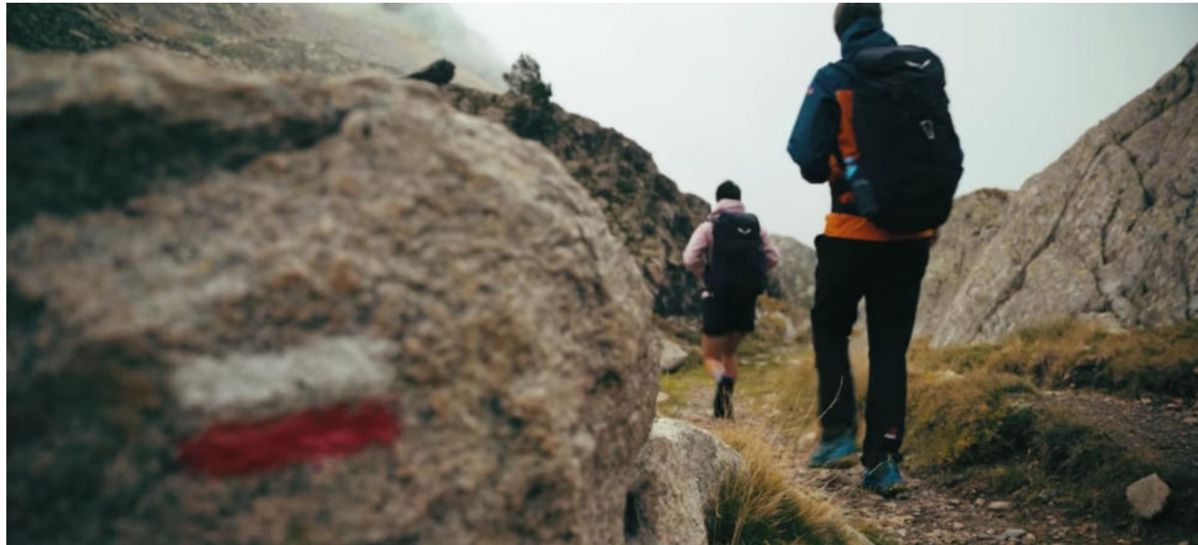
Image issue du reportage filmé en 2025, disponible sur notre chaîne Youtube