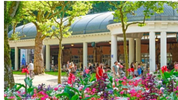
Vittel Vosges (88)