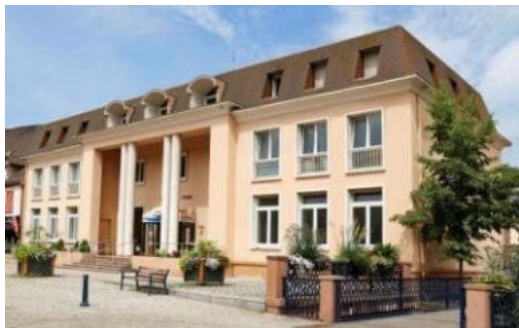
Niederbronn-les-Bains Bourbonne-les Bains Bas-Rhin (67) Haute-Marne (52)