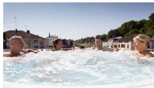
Contrexéville Vosges (88)