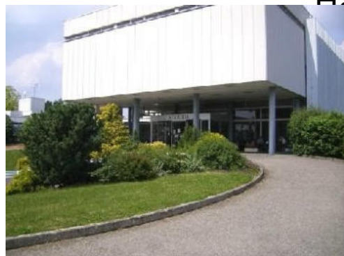
Morsbronn-les-Bains Amnéville-les-Thermes Bas-Rhin (67) (57)